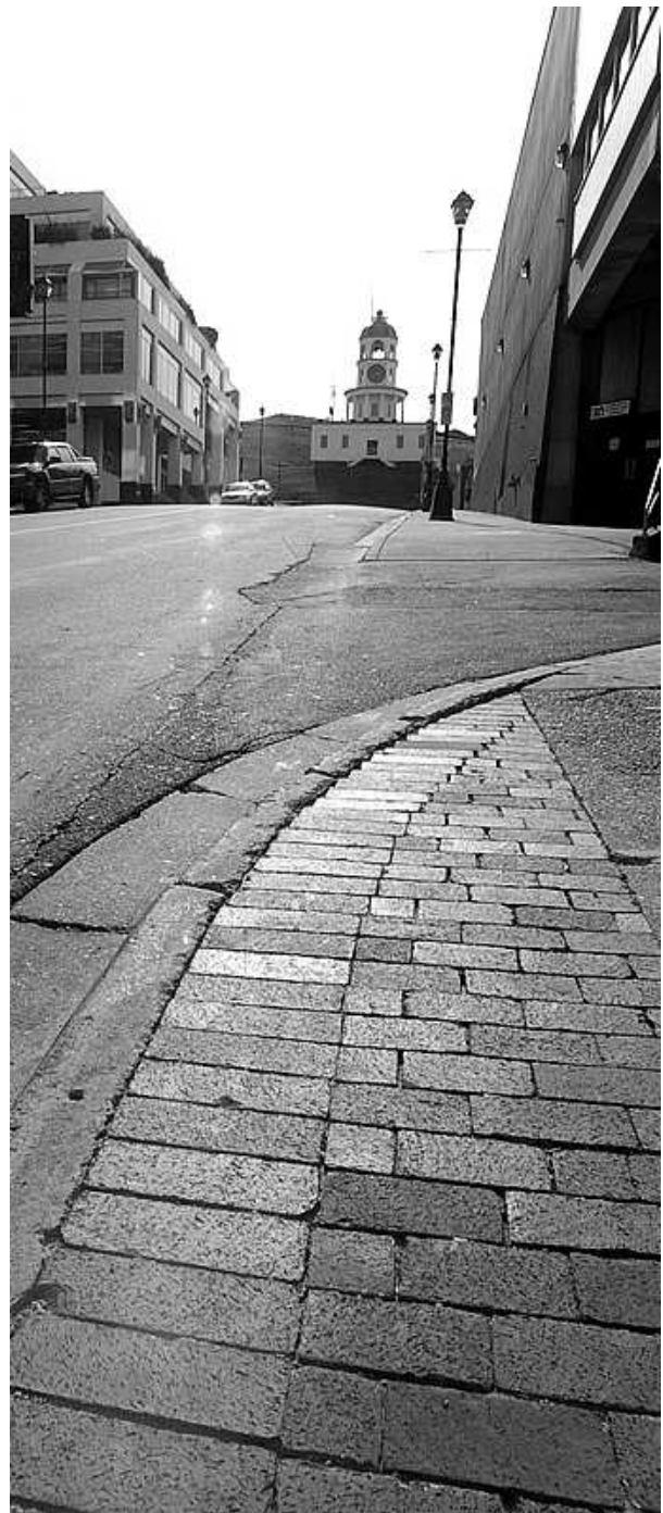
Die Town Clock ist das Wahrzeichen von Halifax. Sie steht hoch oben auf dem Citadel Hill direkt hinter Downtown. In ihrer bewegten Geschichte verteidigte sich die Stadt, die 1749 als Siedlung für das britische Militär errichtet wurde, mehrfach gegen Frankreich.

Für weitere Fragen stehe ich jederzeit gerne unter maxschmitt@gmx.de zur Verfügung. Mehr Informationen und Fotos aus meinem Jahr in Halifax gibt's auf www.xammm.com/halifax .